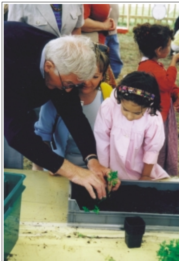
" Scènes de jardin " Bordeaux en juin 98.

Face aux mille et une facettes et travaux du jardin, comme face à la complexité de l'environnement, les objectifs peuvent se multiplier avec bonheur. Le jardin sera d'autant plus riche que ses vocations seront multiples : sociale, éducative, écologique, esthétique, ludique... De mêmes, ils sont nombreux ceux qui sont attirés par le jardin aussi, jardin et usagers auront un bénéfice plus grand si des objectifs multiples se tissent avec des publics multiples. Retraités, enfants, familles, personnes seules, chacun des participants apporte son expérience, sa curiosité, sa candeur, sa force, sa poésie, son écoute et bien sûr ses envies.