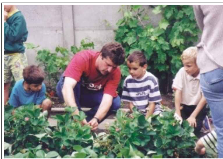
A la découverte du jardin des Jardiniers de France à Valenciennes (Nord).

L'approche scientifique , elle aussi assez évidente dans un jardin, consiste-en la mise en œuvre de démarches scientifiques et expérimentales pour comprendre le fonctionnement du vivant... On pourra ainsi expérimenter le rôle de l'eau, de la lumière et des différents «facteurs écologiques» sur la croissance des plantes, analyser l'influence de l'orientation ou du type de sol sur la végétation, comparer différentes techniques culturales, les variétés, étudier les habitants «sauvages» du jardin et leurs interactions. De là, on pourra développer des approches dites " systémiques ", considérant le jardin comme un système complexe dont on peut comprendre les flux (l'eau, la matière, l'énergie...) et le fonctionnement global.